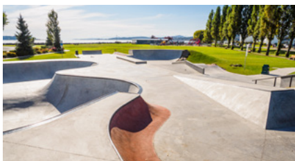
„Sachkunde – Kontrolle und Wartung von öffentlichen Skate- / Parkour-Anlagen.“

Weitere Informationen unter: www.tuv.com/seminare-spielplatz